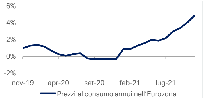
Grafico 1: Prezzi al consumo annui nell'Eurozona

Fonte: Bloomberg Finance LP, Deutsche Bank AG. 3 dicembre 2021